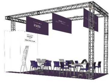
※『iroots』出展ブースイメージ