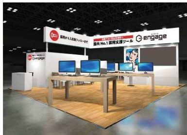
※『engage』出展ブースイメージ