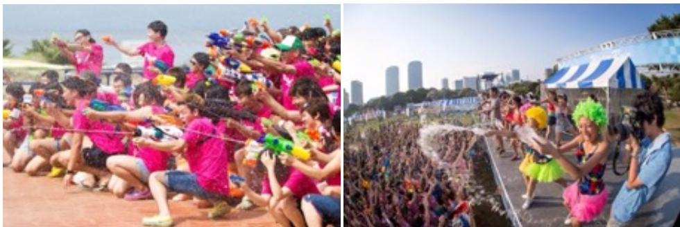
Water Run Festival 2018の様子

なお、 5月22日(水)10:00～6月3日(月)23:59 の期間、公式サイト( http://waterrun.jp/ )にて、数量限定の先行チケットを発売します。