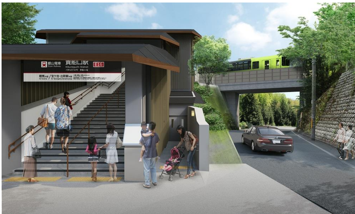
リニューアル後の貴船口駅(イメージ)