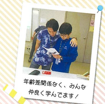
年齢差関係なく、みんな 仲良く学んでいます!