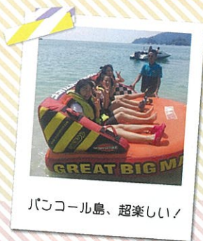
バンコール島、超楽しい!