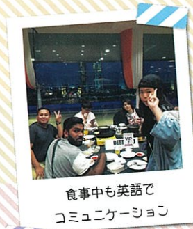
食事中も英語で コミュニケーション