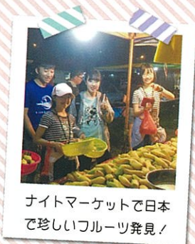
ナイトマーケットで日本 で珍しいフルーツ発見!