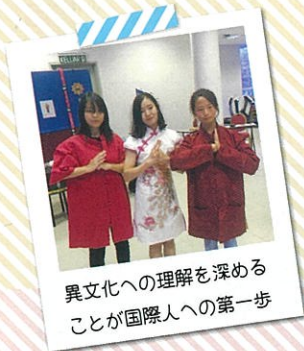
異文化への理解を深める ことが国際人への第一歩