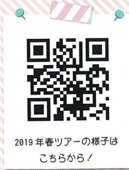
2019年春ツアーの様子は こちらから!