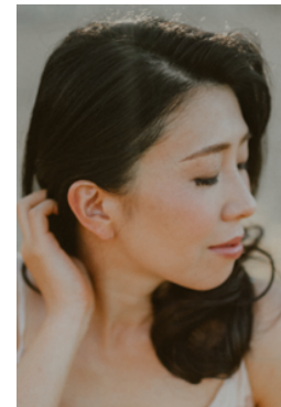
立原綾乃 シンガー