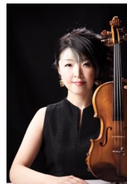
杉原桐子 ヴァイオリン