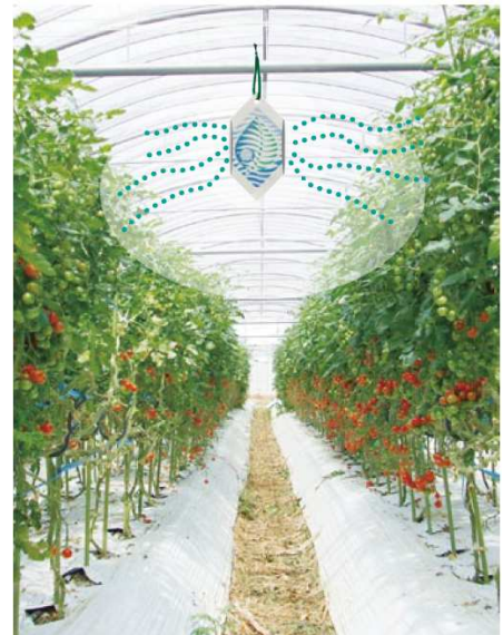
【圃場吊り下げイメージ】