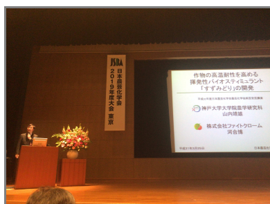
受賞講演(東京農業大学百周年記念講堂)