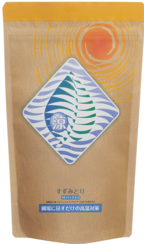
【商品本体:10パック入り】