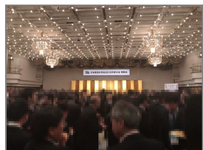
懇親会(京王プラザホテル)