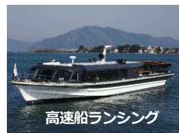
高速船ランシング

草津烏丸半島港発着にて 45 分のショートクルーズを運航します。滋賀県立琵琶湖博物館から徒歩約 5 分、ご家族にオススメのお手軽なコースです。琵琶湖大橋のくぐり抜けも体験していただけます。