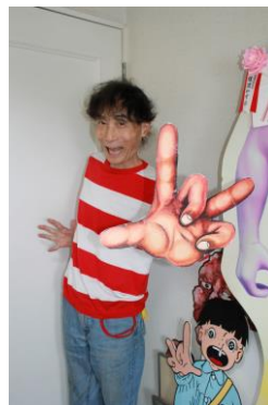
漫画家 椋図かずお先生

数々のヒット作品を長年に渡って生み出し続けてきた日本を代表する漫画家。代表作に『漂流教室』『おろち』『洗礼』『わたしは真悟』『まことちゃん』など。作品は恐怖ものからSF、ギャグもの、時代劇まで、少年もの、少女もの、青年ものを問わず幅広いが、ホラー漫画の第一人者として特に有名である。