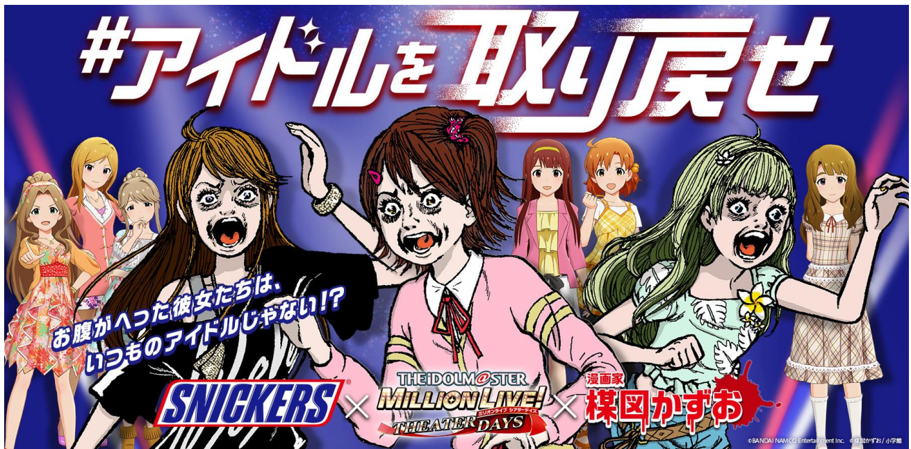
「#アイドルを取り戻せ」セカンドシーズン メインビジュアル

マース ジャパン リミテッド(本社:東京都港区、社長:フー・チャファン)は、人気チョコレートバーブランド「スニッカーズ®」と人気ゲーム「アイドルマスター ミリオンライブ！ シアターデイズ(以下、ミリシタ)」、有名漫画家の榎図かずお先生とコラボレーションしたデジタルキャンペーン、「#アイドルを取り戻せ」のセカンドシーズンを、4月30日10時から開始します。