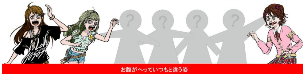
お腹がへっていつもと違う姿