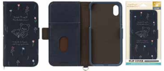
リラックマ / リラックマスタイル (ボタニカル)