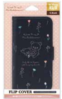
リラックマ/リラックマスタイル (ボタニカル)