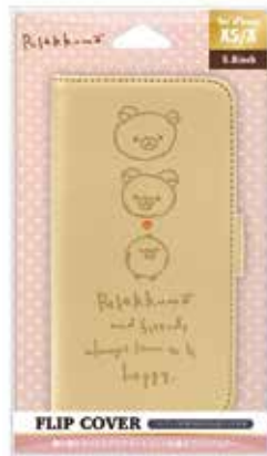
リラックマ/リラックマスタイル (スケッチ)