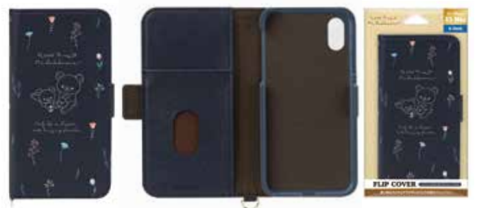
リラックマ / リラックマスタイル (ボタニカル)