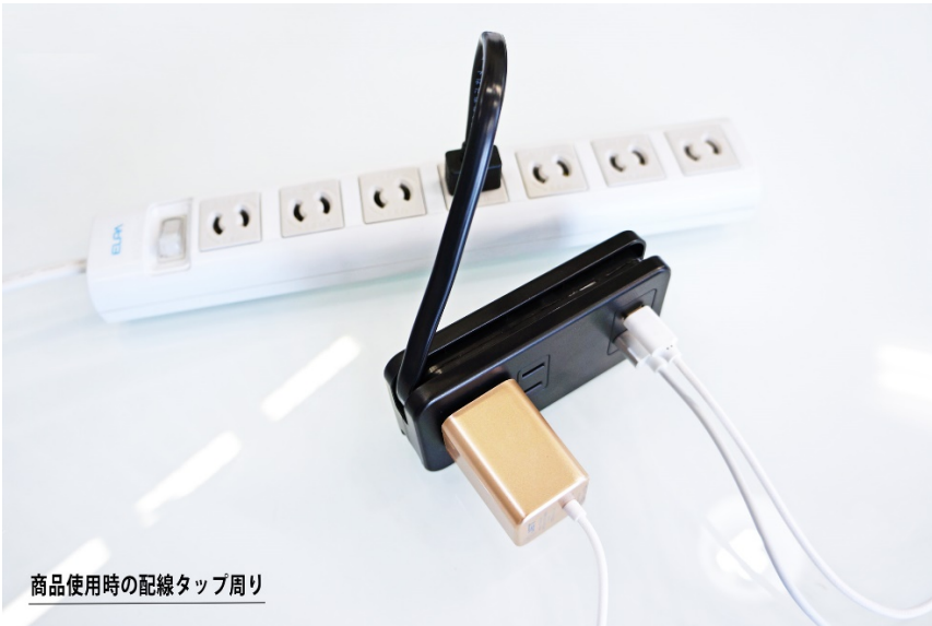
商品使用時の配線タップ周り