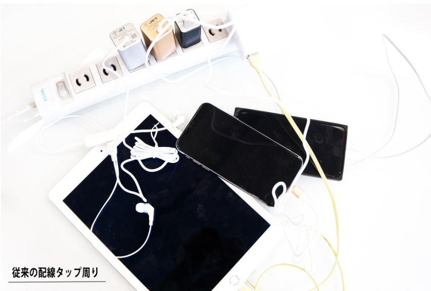
従来の配線タップ周り