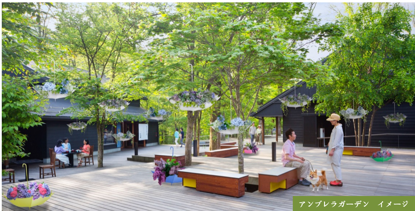
アンブレラガーデン イメージ

「アンブレラガーデン」は、傘をフラワーポットに見立て、アジサイやスパニッシュモスなど雨露に映える植物をフラワーアレンジメントで飾ります。空中に浮かせたアンブレラのフラワーアレンジメントはハルニレの木立の下で、フォトスポットとして映える新しい空間をつくります。