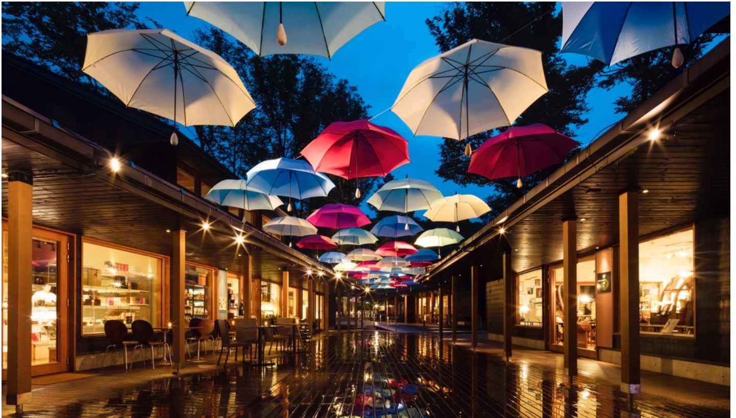
ライトアップで幻想的な景色に。

星野リゾートが運営する日帰り商業施設「軽井沢星野エリア ハルニレテラス」では、2019年6月1日～梅雨が明けるまで、雨を楽しむイベント「軽井沢アンブレラスカイ2019」を開催します。ハルニレテラスの街並みが、100本のカラフルな傘で彩られ、新スポット「アンブレラガーデン」も登場します。