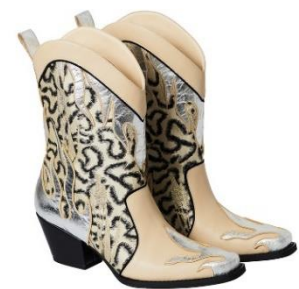
パイナップルの葉から生まれた 代替レザーを使用したカウボーイブーツ