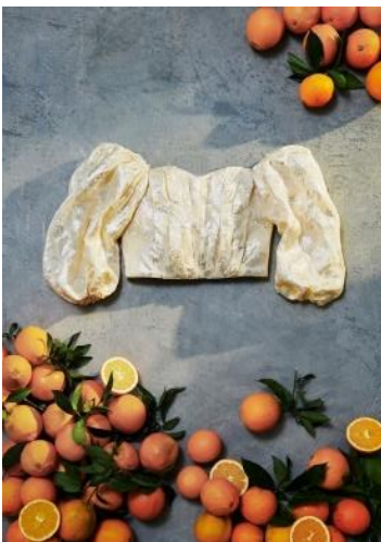
Orange Fiber® (オレンジファイバー)