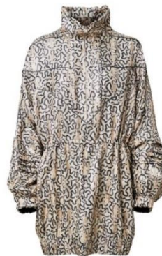
TENCEL™を使用した チュニックドレス