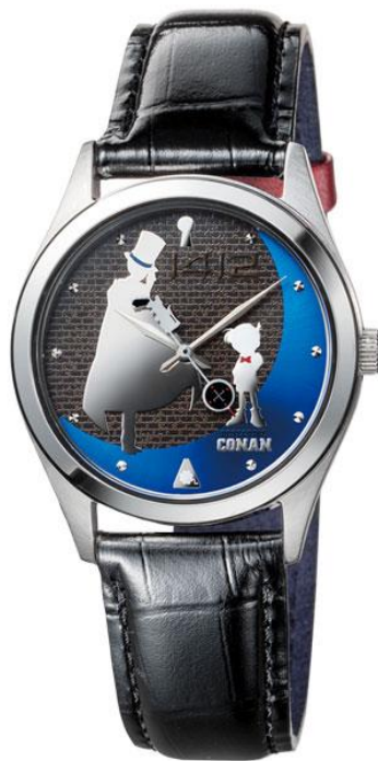
メタルバンドモデル