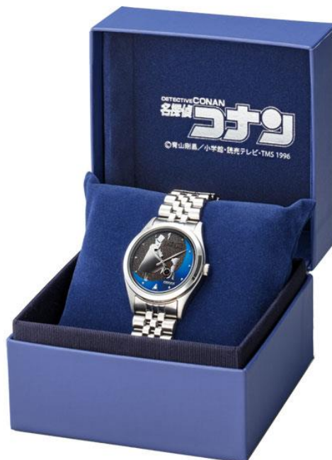
特製ボックス（外側）