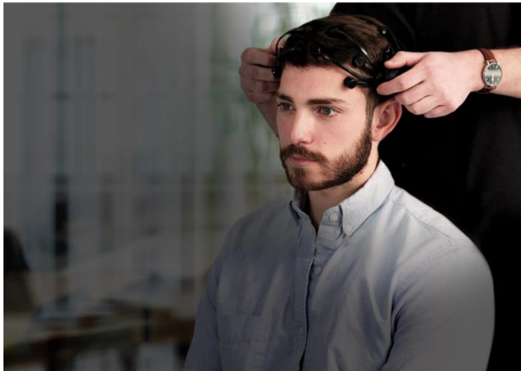
【SNJ調査サービス利用イメージ】