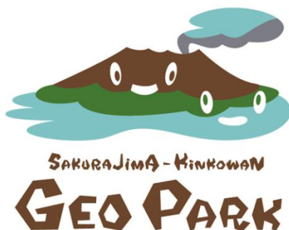
図 桜島・錦江湾ジオパーク ロゴ

これらを踏まえ、第3期鹿児島市観光未来戦略(平成29(2017)年3月策定)の重点施策にも掲げられているとおり、桜島火山そのものを活かした「桜島・錦江湾ジオパーク」、「錦江湾を生かした海の体験」、「まちなか温泉」や、桜島にちなんだ農林水産物も活かした「食の都 鹿児島づくり」、「グリーン・ツーリズム」等、多角的な視点で桜島の資源や恵みを活用し、交流人口の拡大と地域活性化に取り組んでいます。