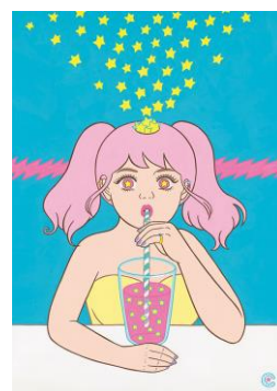
たけい ちか 竹井 千佳