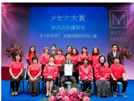
「メセナアワード2018」贈呈式の様子

●「This is MECENAT」に認定されると? : 認定活動にはシンボルである「メセナマーク」を発行します。活動に関する各広報媒体で広くご使用いただけます。認定活動はすべて専用ウェブサイト内「メセナアーカイブ」にて掲載するほか、広報協力をいたします。