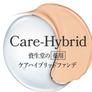
資生堂「薬用 ケアハイブリッドファンデ」ロゴ

資生堂は、「ファンデーションをつけている年 3,500 時間※ 1 が素肌をキレイにする」という新しい美容習慣を、「薬用 ケアハイブリッドファンデ※ 2 」を通じて、2019 年 3 月 21 日(木)より複数のブランドで展開します。