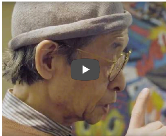
「adicolor by Tanaami」ドキュメンタリー 予告編