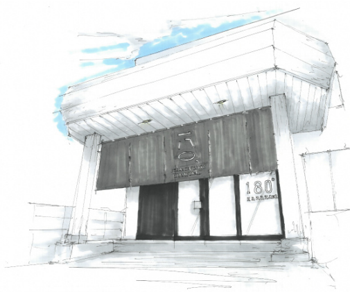
↑シェアハウスのエントランス

↑ネオンで書かれた「Change」は「シェアで人生を180°変えよう」という理念を表現しています。