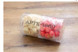
アポトキシソップコーン 600円

アイコン入りの専用ボトルに入ったドリンク。 コナン：甘酸っぱいはちみつレモン味 安室：さわやかなバインナップル味 灰原：深みのあるブルーベリー味