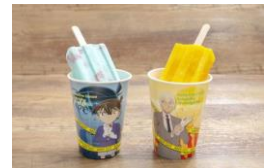
アイスキャンディー 2種 各 500円

コナンVer.：青いのにミルク味！？ ストロベリー果肉入りのアイス 安室Ver.：黄桃の果肉が入ったマンゴー味のアイス