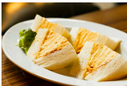
<「喫茶マドラグ」の玉子サンド>