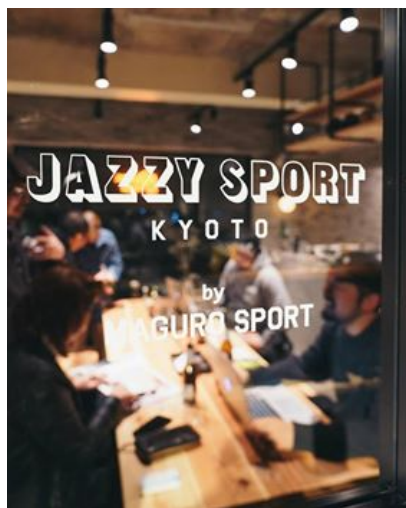
<Jazzy Sport Kyoto>