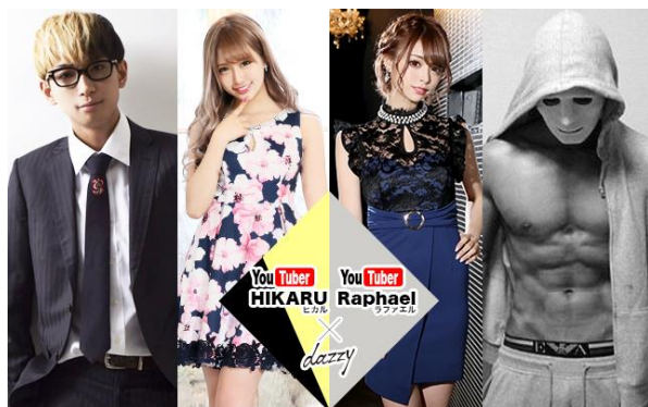
メインビジュアル

■サイトURL : https://dazzystore.com/SmartPhone/Page/youtuberwithdazzy.aspx