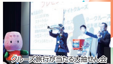
クルーズ旅行が当たる大抽せん会