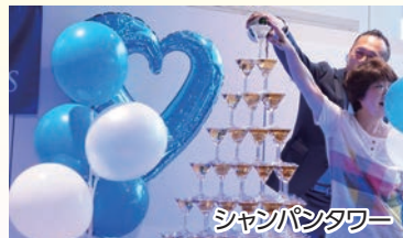
シャンパンタワー