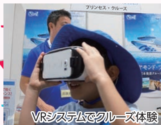
VRシステムでクルーズ体験