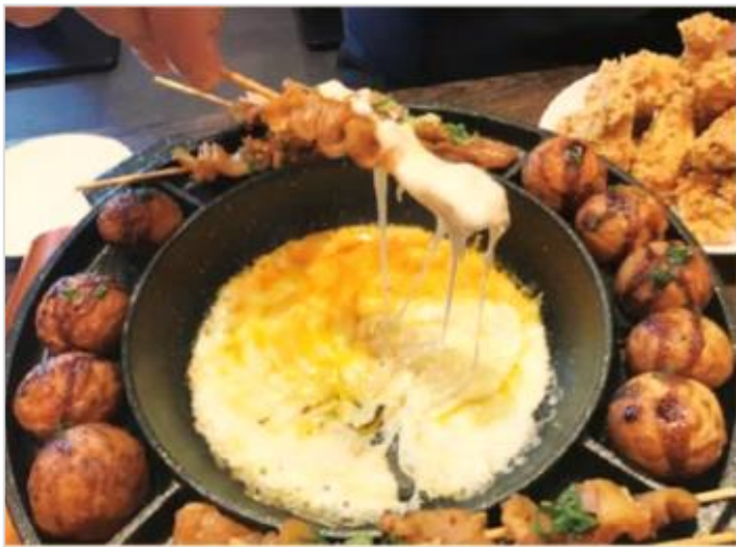
大阪チーズフォンデュ