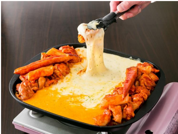
チーズタッカルビ