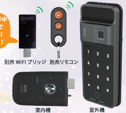
別売 WiFi ブリッジ 別売リモコン

WiFiブリッジで世界中どこからでもアプリで遠隔操作ができます！状態確認も可能です！