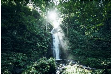
雲井の滝 (くもいのたき)

また、宿泊期間中だけでなく、帰ったあとも、いつでも、どこでも苔を観察できるように、ツアー中に使用する苔観察セットをプレゼントします。苔観察セットには、苔を観察するためのルーペ、苔に水を与える霧吹き、苔の種類と特徴を記載している苔ハンドブックなどが含まれ、それらを使い、好きな苔をじっくり愛でることができます。