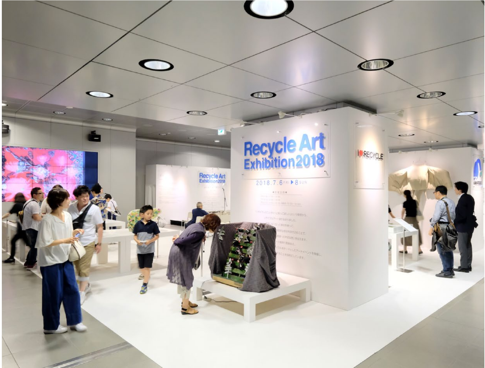
△リサイクルアート展2018