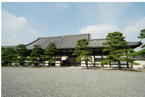
元離宮二条城 二の丸御殿台所（重要文化財）

千年を超えて日本の都であった歴史を背景に、文化の発信地として革新を続けてきた京都。一方、現在、新たな価値創造の中心となっているアートマーケット。そんな京都とアートを融合し、新元号のもと開催する「artKYOTO 2019」では、時代を超える価値あるアートを社会に広く届けるフェアを目指します。