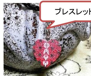
ブレスレット作品