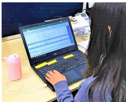
自席に置いてワークスペースの花粉対策に

norox（以下、ノロックス）は、専用の噴霧器やスプレーで除菌消臭成分を噴霧し、ウイルスや菌、ニオイ、花粉のアレル物質等を除去します。介護施設や保育園、多くの人々が往来するショップやホテル、消臭ニーズの高いフィットネス施設等で利用が増え、最近は一一般オフィスでも働き方改革の一つとして注目されています。目に見えないウイルス除去と比べ、花粉・消臭対策の効果は実感しやすく、特に「マスクは着けたくない」「薬は苦手」という花粉に悩むユーザーからは、「自分専用で使えるものが欲しい」との声をいただいていた。そこで、共有スペース向けの従来の噴霧器に加え、新たに個人スペース用のUSB噴霧器を発売する運びとなりました。