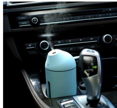
通勤車や営業車でも ※1