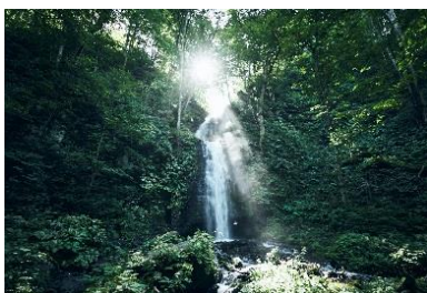
雲井の滝（くもいのたき）