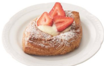
東横のれん街限定

＜ドゥ マゴ ベーカリー＞ とちおとめと2種のクリーム デニッシュ (1個)389円