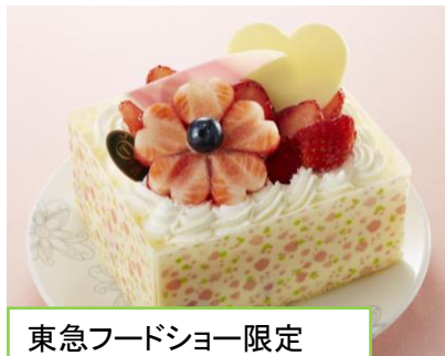
東急フードショー限定

いちごの品種にこだわったタルトやバターたっぷりのデニッシュなどの洋菓子から、いちご大福やいちごをかたどった上生菓子といった和菓子まで旬のいちごをつかったスイーツをご紹介します。イトインではフレッシュないちごをお楽しみいただけるパフェもご用意しました。期間限定のアイテムもご用意して、いちごの季節を満喫していただけるスイーツを提案します。