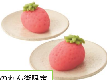
東横のれん街限定