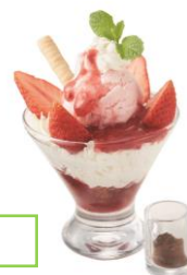
東横のれん街限定