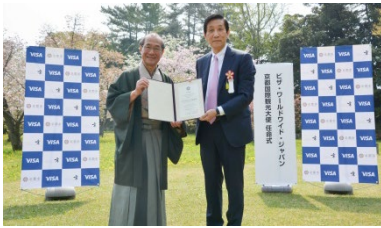
京都国際観光大使任命式