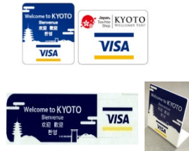
京都オリジナルアクセプタンスマーク