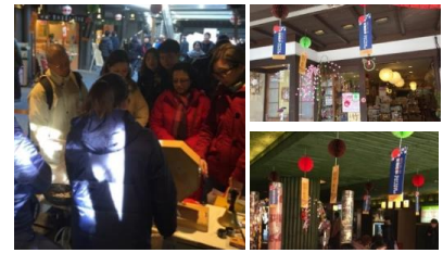
嵯峨嵐山地域での買い物キャンペーン

今後、数多くの国際的なイベントが日本で開催され、日本の魅力に触れることを期待して数多くの方が訪日されることから、Visa との協力体制を強化し、京都市内の隠れた観光スポット等への周遊に繋げる取組を展開します。