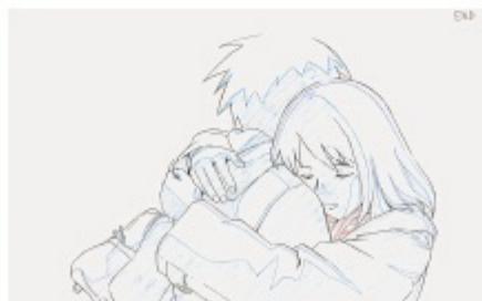
「秒速5センチメートル」西村貴世による原画