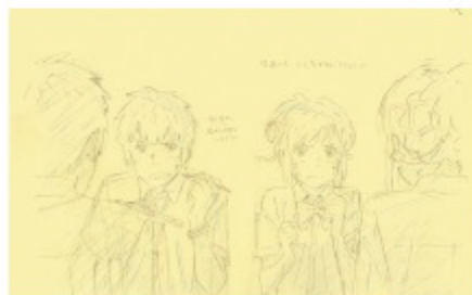
「君の名は。」安藤雅司によるレイアウト修正

アニメーション監督・新海誠とその作品の魅力に、より多くの人が触れ、さらなる理解を深めていただく機会となれば幸いです。