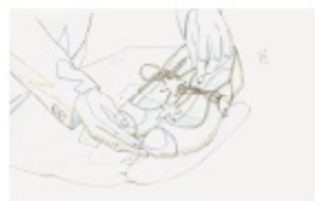
「言の葉の庭」土屋堅一による原画