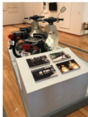
「秒速5センチメートル」コスモナウトに登場したスーパーカップ(再現)

©2017 Makoto Shinkai / 新海誠監督 ©Shodo Studio / ©Shodo Studio / ©Shodo Studio / ©Shodo Studio