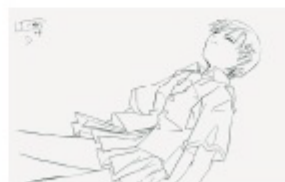
「ほしのこえ」新海誠による原画