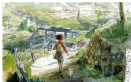
「星を追う子ども」丹治匠によるコンセプトボード