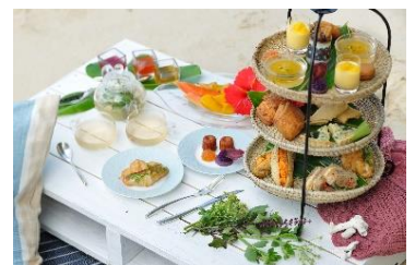
アフタヌーンティーイメージ