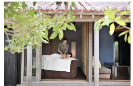
癒しのスパトリートメント