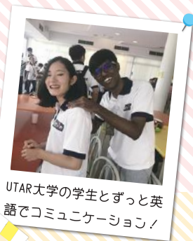
UTAR大学の学生とずっと英語でコミュニケーション!