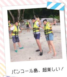
パンコール島、超楽しい!