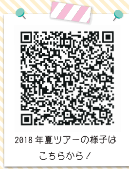
2018年夏ツアーの様子は こちらから!