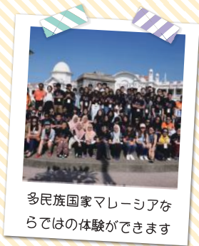
多民族国家マレーシアならではの体験ができます