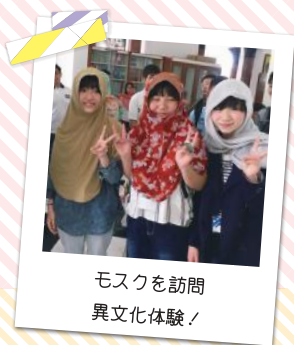
モスクを訪問 異文化体験!