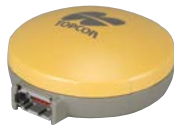
GNSS 受信機 SGR-1 (中精度アンテナ) 精度 30cm