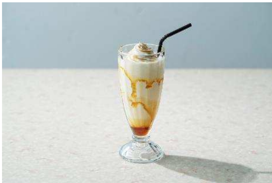
メープルシェイク 500円（税抜）

【本件に関する報道関係者からのお問合せ先】 株式会社シュクレイ 企画開発部 宛 メールアドレス： info@sucrey.co.jp 電話番号：0120-39-8507