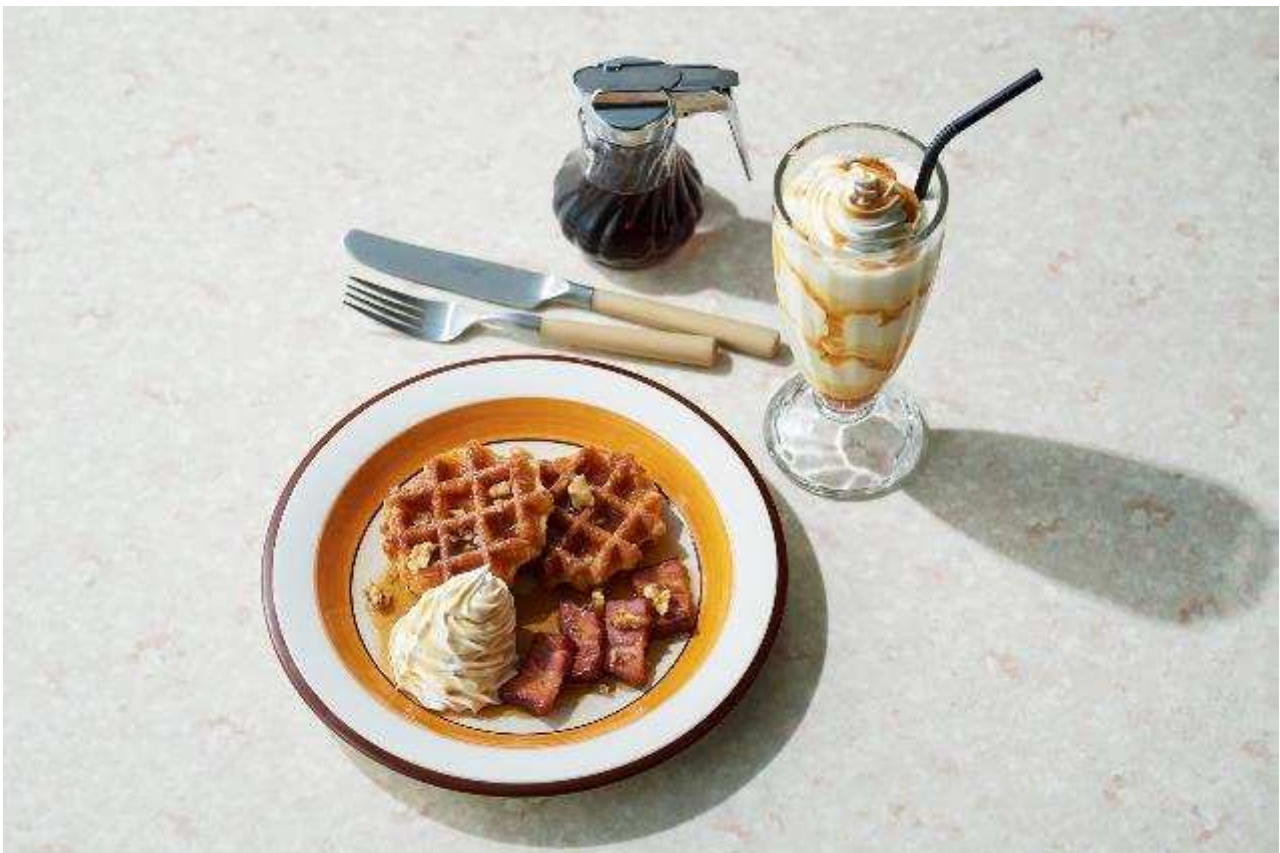
メイプルダイナープレート シェイクセット 1,000円（税抜）