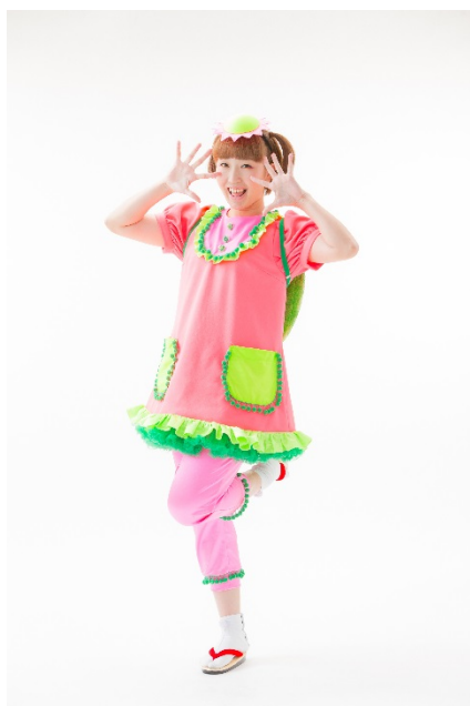
今年は岩手県から「河童ちゃん」(写真左)と徳島県から妖怪たちが参加します。