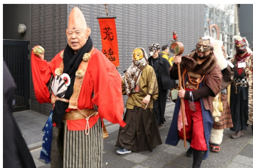
昨年の節分お化け☆百鬼夜行のパレード