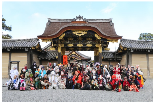
二条城唐門前での記念写真