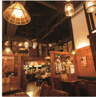
地元伏見で愛される老舗。洋食と言えばココ。