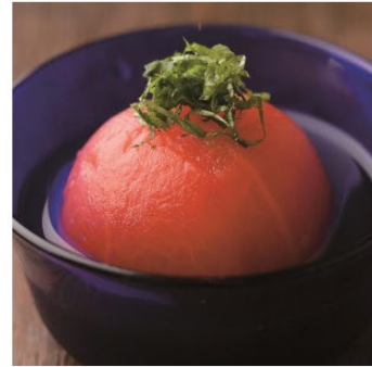
昆布だしが香るおぼんざいと地元伏見の日本酒