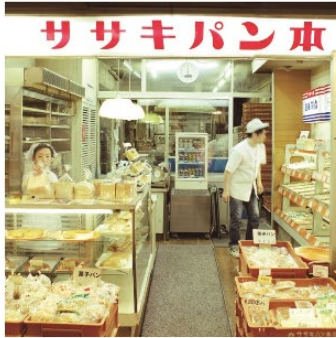
創業大正10年。伏見納屋町のパン屋さん。