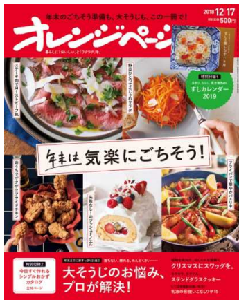
『オレンジページ 12/17号』

株式会社オレンジページ(東京都港区)が月2回発行する生活情報誌『オレンジページ』。最新号『オレンジページ 12/17号』は、「すしカレンダー2019」の付録つき特別定価500円で12月1日(土)に発売になります。クリスマスや年末にぴったりの、気楽に作れるごちそうレシピが満載です。