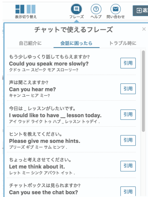
「レッスンルーム」のフレーズ引用機能の画面イメージ（PC ブラウザ版）

また、付属機能である「チャットで使えるフレーズ」は、レッスン中にワンクリックでチャットへ引用できます。「Could you speak more slowly?（もう少しゆっくり話してもらえますか？）」や、「Let me think about it.（ちょっと考えさせてください。）」など、英会話レッスン中によくある困った時のお助け機能として利用できます。