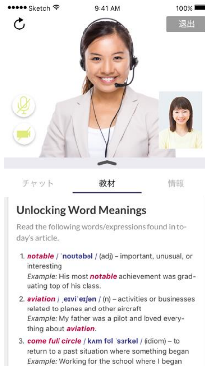
レアジョブ英会話アプリの画面イメージ

レアジョブ英会話アプリは今まで予約専用アプリでしたが、「レッスンルーム」であればアプリ内でレッスンが受講できるようになりました。教材の文字も見やすく、気軽にスマートフォンでレッスンが受講いただけます。