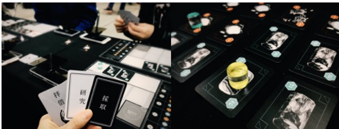
ゲームマーケット2017秋の様子

ゲームマーケット2017秋に出展した際には、1日のみの出展にも関わらず大勢の方に体験いただきました。体験者からは、「自分が作った惑星がホログラムで現れておもしろかった。」「発売が楽しみ。」といった声をいただきました。