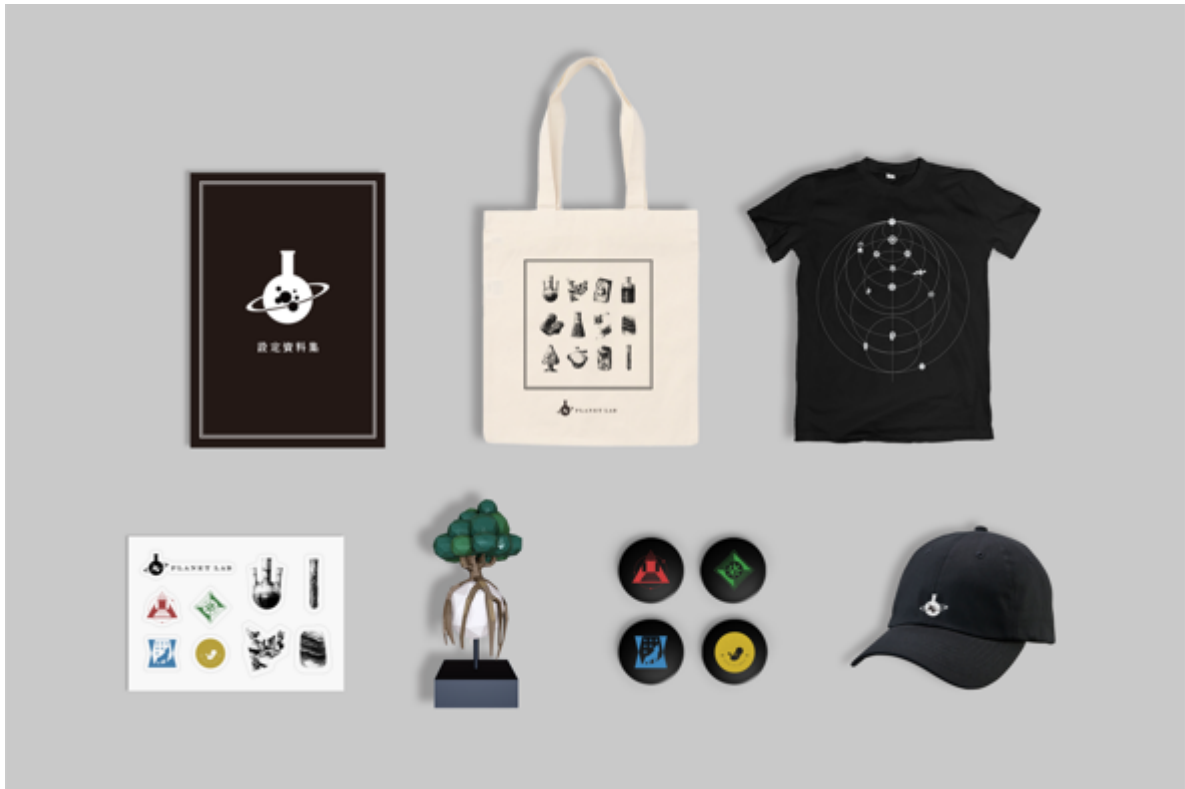
リターンのイメージ画像