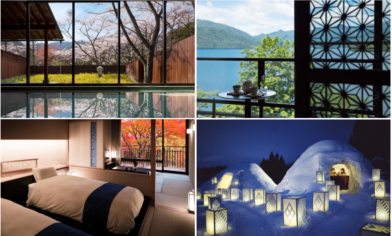
左上：界 鬼怒川（春） 左下：界 鬼怒川（秋）、右上：界 日光（夏）、右下：界 津軽（冬）

2018年12月より若者旅プランは通年で宿泊可能になります。冬は界 アルプスで雪見風呂や中庭のかまくらを体験。夏は標高の高いエリアにある界 日光で中禅寺湖を眺めながら涼やかに過ごしたり、秋は界 津軽で紅葉を眺めながらの入浴や秋の味覚を堪能したりと、四季折々の風景や料理を温泉旅館で体感することができます。温泉旅館のマナーブック「RYOKAN GUIDE」やレンタカーサービスを提供する「タイムズカーレンタル」との連携による、割引特典も昨年度より継続して実施します。