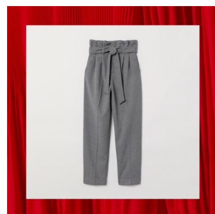
ペーパーバッグパンツ ¥2,499(税込)