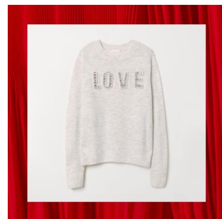
デザインセーター ¥2,999(税込)

■このリリースに関するお問い合わせや取材、資料をご希望の方は下記までご連絡ください■