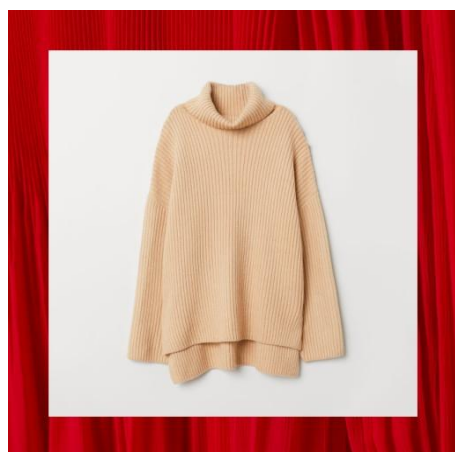
タートルネックセーター ¥5,999(税込)