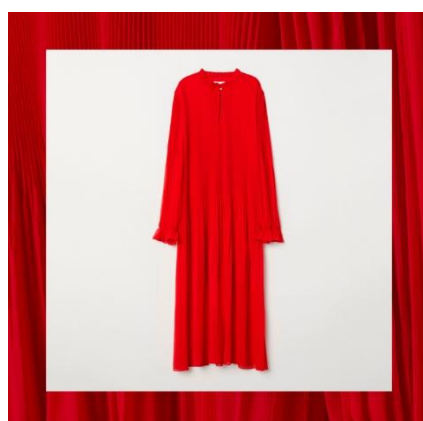
プリーツシフォンワンピース ¥5,999(税込)