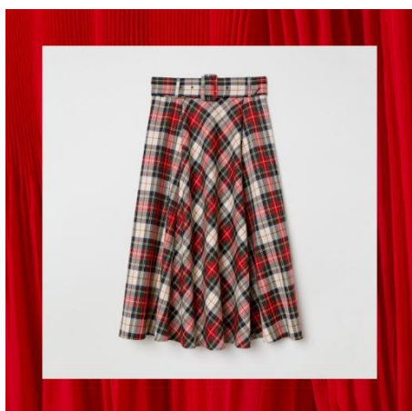
ベルスカート ¥5,999(税込)