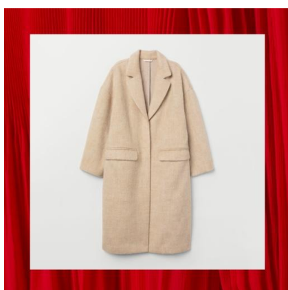
ニーレングスコート ¥8,499(税込)