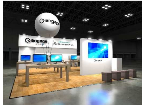
※『engage』出展ブースイメージ