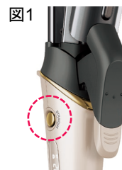
図1 ワンタッチ切替ボタン (カール/ストレート)

好評のスチーム機能をさらにお楽しみ頂けるよう、本製品ではスチーム放出エリアをストレート面は約10%、カール面は約20%拡大しました。 ※2 たっぷりのスチームが、根元から毛先までやわらかな手触りの髪へと導き、スタイルを長時間キープします。