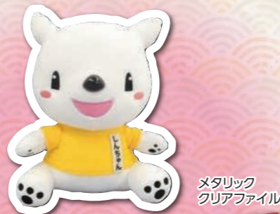
メタリッククリアファイル

※当選者の発表は、賞品の発送をもってかえさせていただきます。 ※賞品の指定はできません。