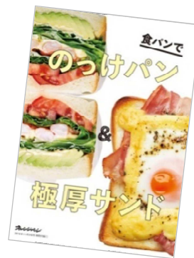
『オレンジページ 11/2号』