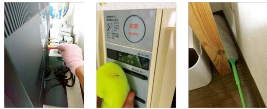
部員が自宅で試した実際の写真を使用感とともに掲載