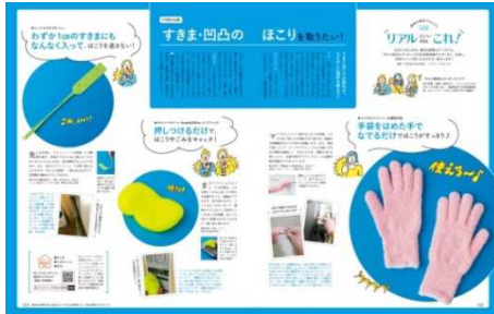
「読者の視点でセレクト リアルにいいのは、これ！」

『オレンジページ』2018年7/2号からスタート、9回目を迎えた連載「リアルにいいのは、これ！」。読者編集部員「サロンWEBエディターズ」(*)が、ちまたにあふれる便利グッズなどを生活者目線でリサーチしお試し。本音で「いい！」と思ったものだけを厳選して紹介するコーナーです。読者アンケートには、このページをきっかけに実際の購入を決めたという声も多数寄せられています。企画を進めるにあたり、コミュニティサイト「オレンジページサロンWEB」のエディターズ限定公開のコミュニティで、編集担当も交えて意見や情報を交換。このいわば「インターネット編集会議」から、毎号、このページは生まれています。